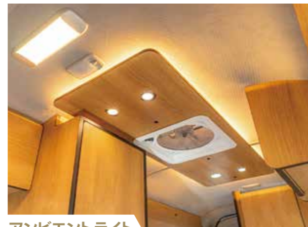
アンビエントライト 上質な空間を引き立たせます。ダウンライトは調光式。