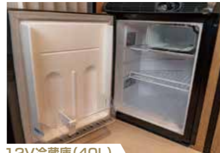
12V冷蔵庫(40L) 大容量の冷蔵庫が車旅を支えます。