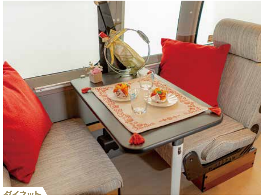
ダイネット 2名対面でくつろげます。