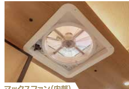
マックスファン(内部) エアコン使用ほどでもない場合など強力な換気性能を発揮。