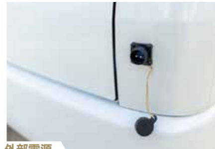
外部電源 車内100Vコンセントも使えバッテリーにも充電します。