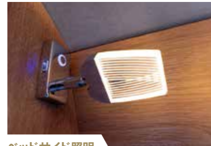
ベッドサイド照明 就寝時などにベッドヘッド用の照明を装備。USB端子付。