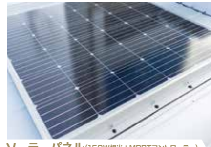
ソーラーパネル (150W相当+MPPTコントローラー) リチウムイオンバッテリー(200A)の充電を補完します。