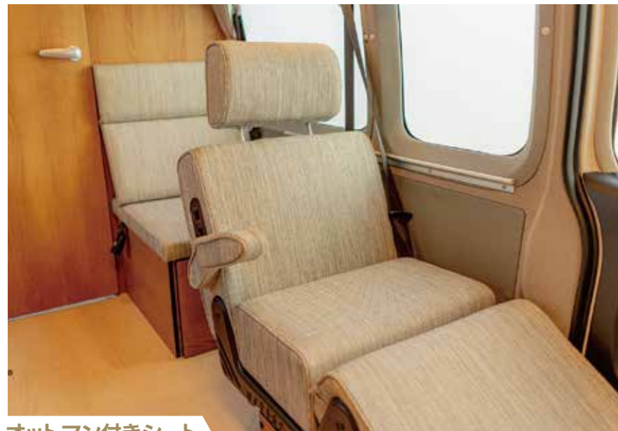
オットマン付きシート リラックスできるオットマンシート、アームレスト付き。