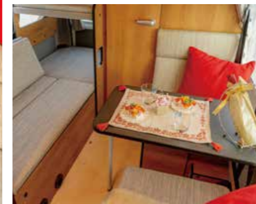
2段ベッドは簡単にソファーになりダイネットを囲めます。