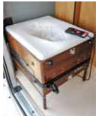
ラップボン ポータブルトイレをラップボンに変更も可能です。 *オプション 熱圧着式自動排泄処理ポータブルトイレ1回ごとに密封し、洗浄の手間がかかりません。