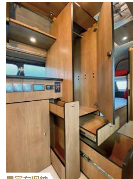
豊富な収納 車旅には収納が重要です。衣類を納めるワードローブと引き出し式の収納。