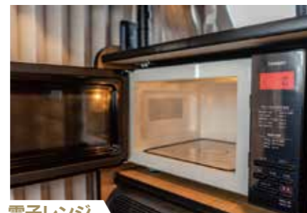
電子レンジ 何かと便利な電子レンジを標準装備