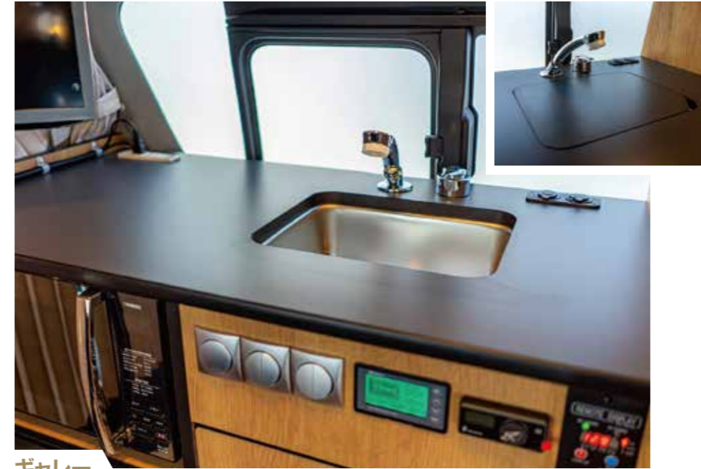
ギャレー 蓋付きのシンク、電子レンジ・冷蔵庫や各部コントローラーをまとめて設置。