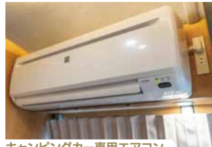
キャンピングカー専用エアコン 冷房・除湿に特化したキャンピングカー専用エアコンです。