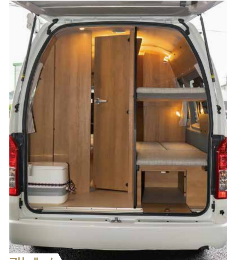
フリールーム 後部のフリールームには、ドアをつけてプライバシーを保ちトイレの設置や収納に活かせます。ベッド下にも収納があります。