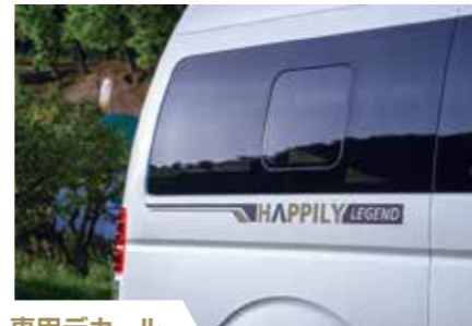
専用デカール ハピリーレジェントオリジナルのデカールを標準装備。