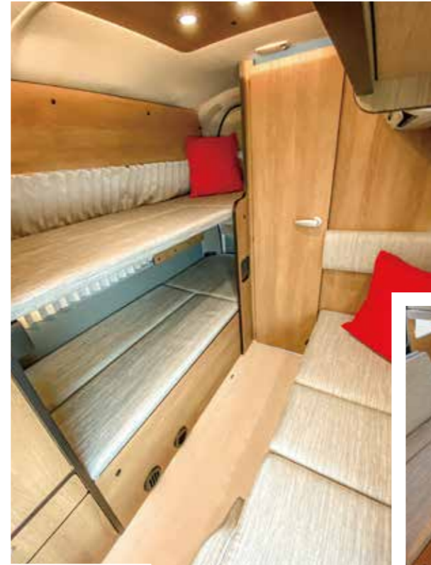
上下2段ベッド ベッドメイクの手間が不要な2段ベッド。上下でプライバシーも保てます。