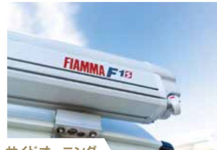
サイドオーニング オートキャンプには欠かせないサイドオーニング。 *オプション