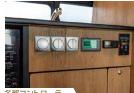
各部コントローラー 一箇所にまとめた操作部、バッテリー残量計装備。