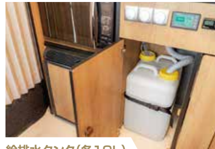
給排水タンク(各19L) 各20Lの給排水タンクをシンク下に設置。