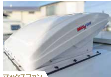
マックスファン 室内の換気に定評あるマックスファンを標準装備。