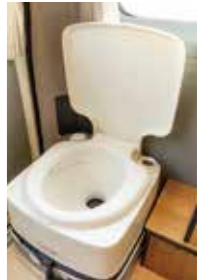
ポータブルトイレ フリールームには、ポータブルトイレを設置。