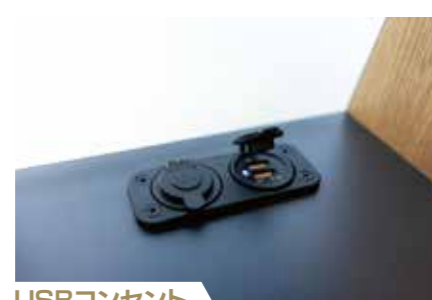
USBコンセント スマホの充電などに必要なUSBを装備。