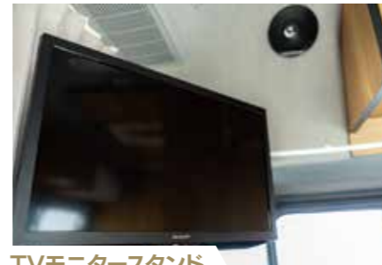
TVモニタースタンド TVモニターの設置に便利。*オプション