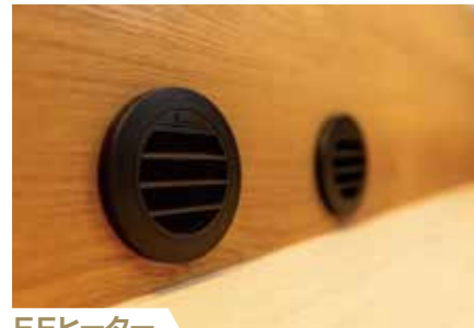
FFヒーター エンジン停止時は車の燃料を使って室内を暖めます。