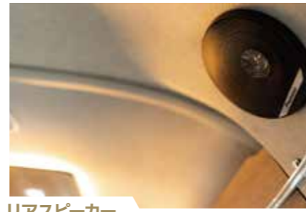
リアスピーカー 臨場感あふれるサウンドを奏でます。 *オプション